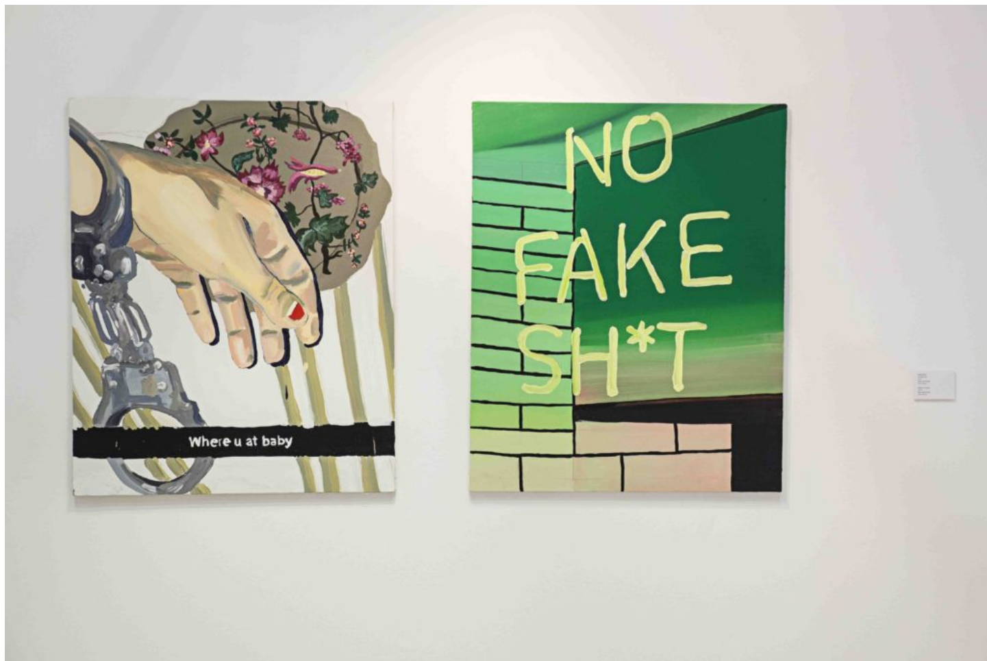
Gala Knörr, Where u at baby, 2016; Gala Knörr, No Fake Shit, 2016

Gala Knörr se sitúa precisamente en esa línea que separa la alta cultura de la cultura basura: el consumo rápido de imágenes y la saturación a la que nos somete internet es su campo de estudio. La pintura de una berenjena como guiño cómico conecta emojis y jeroglíficos en un montaje que incluye pinturas inspiradas en las fotos del teléfono móvil de la artista.