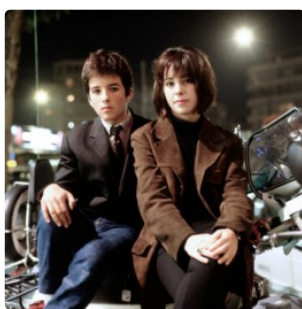
CA2M: un verano para regresar a los ochenta