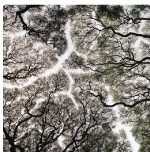
Matías Costa gana el Premio de Fotografía Banca March