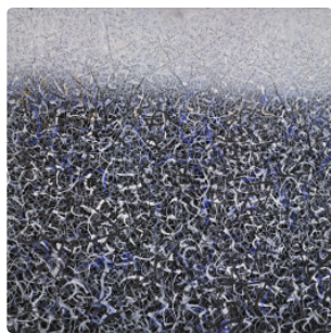
Mark Tobey, pintar con el ánimo