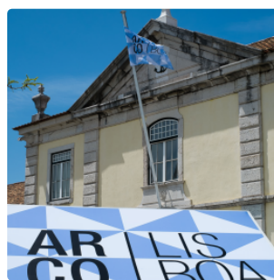
ARCOLisboa 2017 coincidirá con el Encuentro de Museos de Europa e Iberoamérica